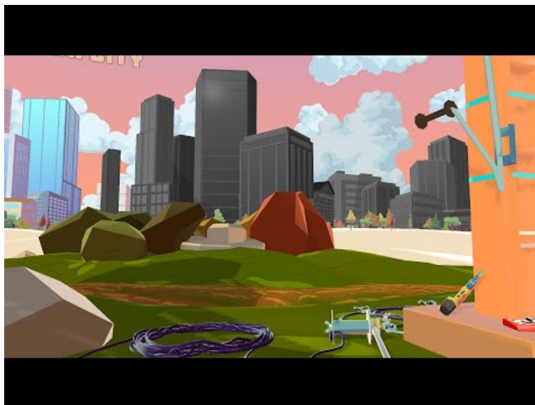
Trailer Salt'O - produit par Studio Nyx (Video Youtube)

Utilisant la Réalité Virtuelle, le jeu a pour objectif de faire découvrir trois métiers : technicien de conduite, intervenant Energie, technicien poste source. Il consiste pour cela à remettre l'électricité dans "Toon city" alors plongée dans l'obscurité.