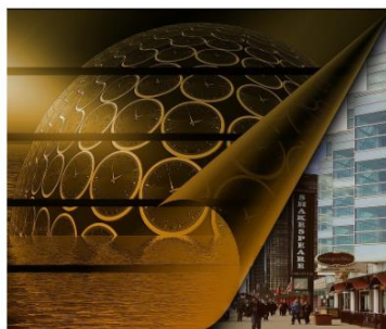
"La continuité du temps" par uroburos, Pixabay

Vidéo de présentation de la formation dispensée le 13 Novembre 2020 :