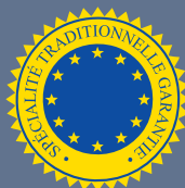
LES PRODUITS BÉNÉFICIAINT D'UNE SPÉCIALITÉ TRADITIONNELLE GARANTIE (STG)

54 produits bénéficient de la mention STG en Europe, tels que la mozzarella en Italie, le jambon Serrano en Espagne ou la moule de Bouchot en France.