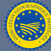
LES PRODUITS BÉNÉFICIAINT D'UNE INDICATION GÉOGRAPHIQUE (IGP)