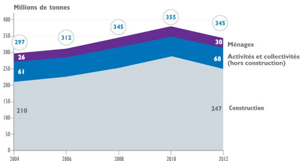
Figure 4 – Évolution de la production de déchets en France entre 2004 et 2012 8

Les autres producteurs de déchets sont les entreprises hors BTP (industrie, services, transport, commerce, agriculture, produisant 18,3 % des déchets) et les collectivités (1,2 % des déchets).