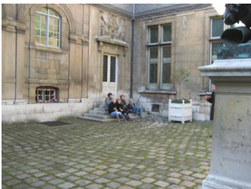
Le musée Carnavalet et son jardin intérieur

En fin de matinée, les élèves ont parcouru le musée Carnavalet qui relate l'histoire de Paris, des origines à nos jours, ensuite, direction le quartier du Marais et le Centre Pompidou, musée d'art moderne.