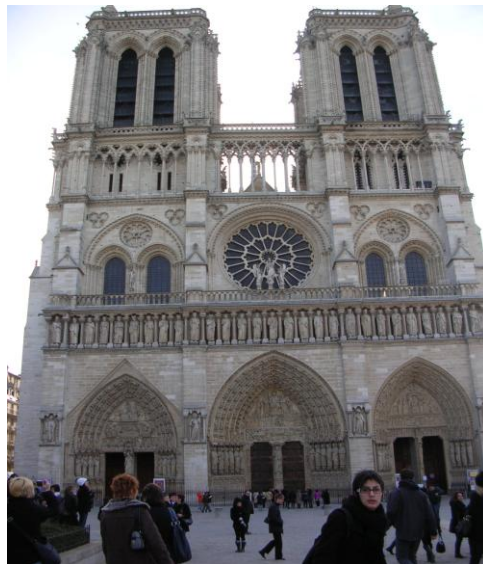
La façade gothique de Notre-Dame

Quant au deuxième jour, après le petit déjeuner et un mémorable trajet en métro, découverte de la place des Vosges et de la cathédrale Notre-Dame, haut lieu touristique qui a inspiré bien des artistes et des écrivains comme Victor Hugo.