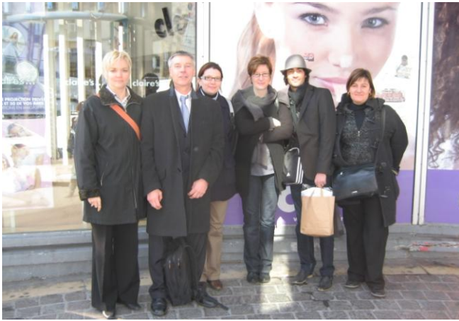
Les accompagnateurs devant le centre de formation Eugène Perma