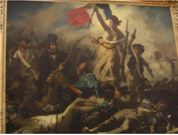
La Liberté, tableau de Delacroix