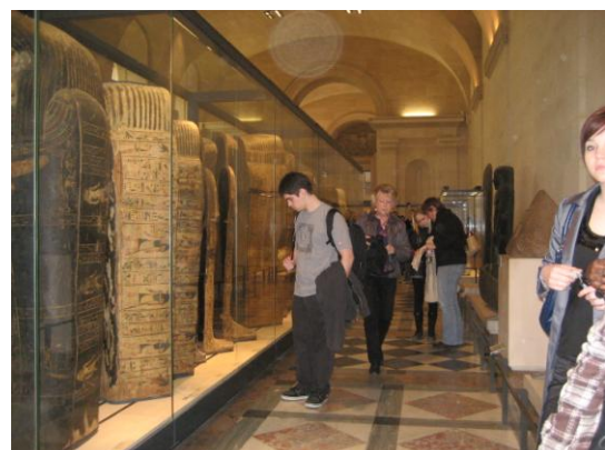
Des sarcophages égyptiens