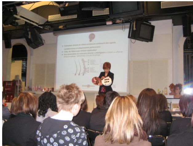
Explication théorique sur la coloration

Après un petit moment de détente pour la pause-déjeuner, en route pour une visite exceptionnelle, celle du musée du Louvre où les élèves ont pu admirer et découvrir de nombreux tableaux célèbres ainsi que des salles réservées aux antiquités égyptiennes et gréco-romaines.