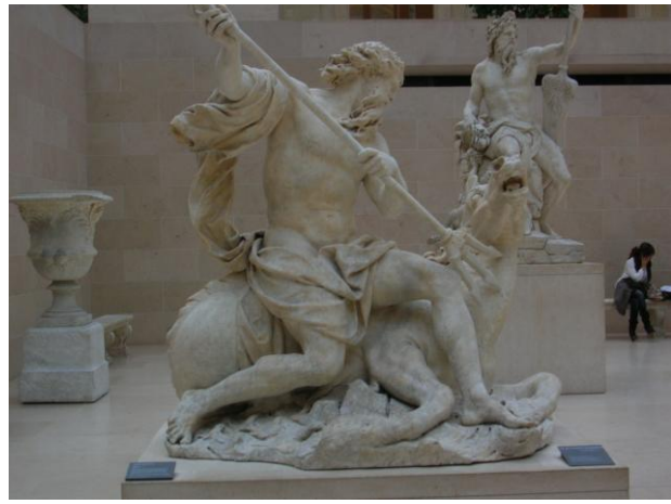
Le dieu Neptune

Quant au deuxième jour, après le petit déjeuner et un mémorable trajet en métro, découverte de la place des Vosges et de la cathédrale Notre-Dame, haut lieu touristique qui a inspiré bien des artistes et des écrivains comme Victor Hugo.