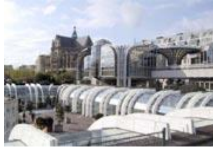
Les terrasses du Forum

Après s'être restaurés à midi, les élèves ont pu finir leur séjour parisien par un détour au Forum des Halles, centre de commerces, de culture et de loisirs. Ce temps libre leur a permis de mettre un point final à leurs deux jours passés dans la capitale.