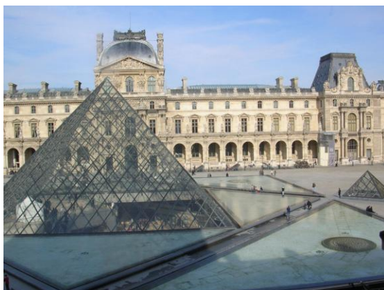
Le Louvre et sa pyramide

Après un petit moment de détente pour la pause-déjeuner, en route pour une visite exceptionnelle, celle du musée du Louvre où les élèves ont pu admirer et découvrir de nombreux tableaux célèbres ainsi que des salles réservées aux antiquités égyptiennes et gréco-romaines.