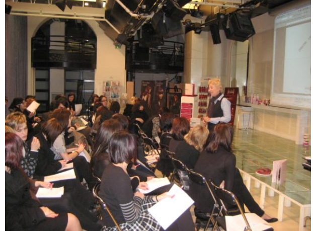
Les élèves devant la formatrice d'Eugène Perma