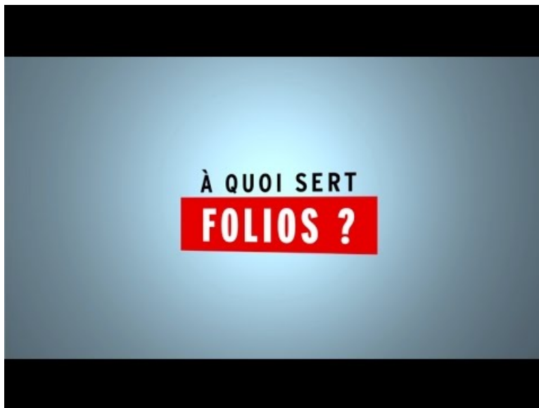
Vidéo A quoi sert Folio (Video Youtube) Vidéo "A quoi sert Folios ?" de ONISEP Nouvelle-Aquitaine

○ Côté élèves : c'est une application qui leur permet :