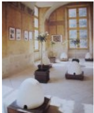
Ian Hamilton Finlay