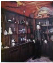
Guillaume Bijl, Le cabinet de Claude Gouffier

Faire rêver le visiteur.... en créant une collection à la fois unique, digne d'émerveillement mais surtout inscrite dans son époque. L'idée de la collection n'était pas de copier un cabinet de curiosités, tel qu'on pouvait en voir au XVIème, comme le clin d'œil de Guillaume Bijl dans son installation type musée Grévin, mais de demander aux artistes d'aujourd'hui de réfléchir à une interprétation de ce type de collection.