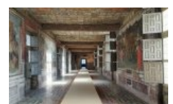
Galerie Renaissance au château d'Oiron

Cette immense galerie Renaissance qui représente un des plus grands décors peints en France à cette époque (dit dans le style de l'école de Fontainebleau) est l'occasion pour les élèves de se rappeler quelques épisodes célèbres de la guerre de Troie et des aventures d'Enée, mais aussi de faire des rapprochements avec des œuvres de la collection comme les guerriers en armure imaginés par Daniel Spoerri dans ses corps en morceaux ou le Pégase-Licorne de Thomas Grünfeld.