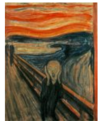
Tempera sur carton