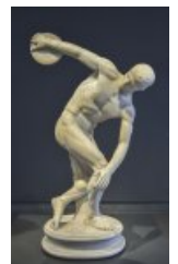
de type ronde-bosse

Enfin, les élèves ayant achevé leur réalisation s'attèlent à concevoir un dispositif de présentation adapté au type de sculpture produit.