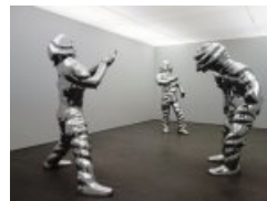
de type ronde-bosse