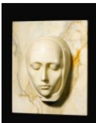
de type haut-relief