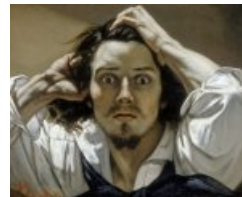
huile sur toile