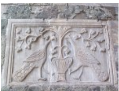
de type bas-relief

Quelques reproductions d'œuvres permettant de caractériser leurs sculptures sont projetées au tableau : à quel type de sculpture appartient ma réalisation ?