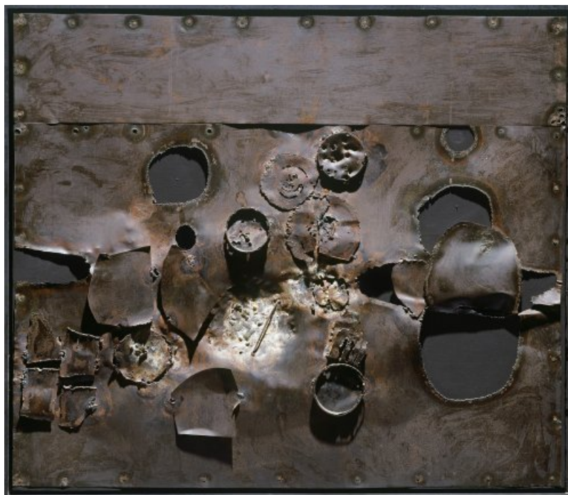
Fer sur toile

Tout au long du travail, l'accent est mis sur la formulation des procédures techniques par l'utilisation d'un vocabulaire spécifique.