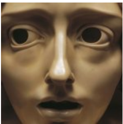
Marbre et dorure (détail)