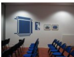
Dispositif d'Heidi Wood dans la galerie du collège François Rabelais