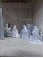
Camille et Sandrine 1ère photo

Suite à ce bilan, j'ai laissé la possibilité aux élèves de refaire une photographie de leur maquette, en choisissant, cette fois-ci le point de vue qui leur semblait le plus approprié. Ils ont pu aussi utiliser la fonction "recadrage" dans un logiciel de retouche d'image pour coller au plus près au format du tableau.