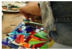
comment réaliser un vitrail/mosaïque ?

"L'après midi du jeudi 20 septembre, nous sommes allés avec les classes d'arts visuels au musée du vitrail de Curzay sur Vonne , un petit village au sud du Poitou.