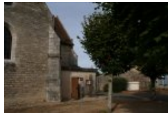
entrée du musée du vitrail à Curzay sur vonne

Reprise de nos activités et de nos visites pour cette nouvelle année scolaire . Nous avons commencé par la visite du musée du vitrail situé dans la vienne à Curzay sur Vonne ↗ . Les élèves rédigent les articles qui sont ensuite publiés sur ce site. Nous développons ainsi les compétences relatives à la culture personnelle en s'ouvrant à des oeuvres patrimoniales, auxquelles s'ajoutent l'aptitude à formuler à l'écrit, tout en donnant sens aux activités artistiques et en en percevant les enjeux.