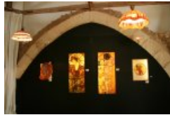
"La belle époque" : une vue sur quelques oeuvres de l'exposition temporaire .

" Le musée du vitrail de Curzay sur Vonne entre Poitiers et Niort , nous présente cette saison une exposition sur la création du vitrail à la belle époque, entre la fin du 19 ème siècle et le début du 20 ème siècle. Le vitrail inspire de nombreux peintres, il reprend alors une place importante dans l'architecture civile. Les démonstrations de techniques de fabrication permettent de comprendre la grande diversité graphique du vitrail. Ce musée met en valeur une création souvent méconnue." Léa