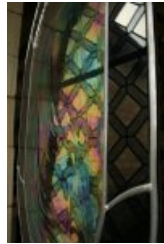
Vitrail contemporain , réalisé pour l'exposition "la belle époque" .

" Le musée du vitrail de Curzay sur Vonne entre Poitiers et Niort , nous présente cette saison une exposition sur la création du vitrail à la belle époque, entre la fin du 19 ème siècle et le début du 20 ème siècle. Le vitrail inspire de nombreux peintres, il reprend alors une place importante dans l'architecture civile. Les démonstrations de techniques de fabrication permettent de comprendre la grande diversité graphique du vitrail. Ce musée met en valeur une création souvent méconnue." Léa