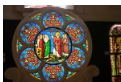
Rosace saint Martin , atelier Lobin, Tours, fin du XIX ème siècle.

Le musée , vous fera découvrir à travers un petit court métrage , toute la difficulté et le travail nécessaire à cet art. Vous entrerez dans un monde empli de formes et de couleurs où se mêlent réalisme et abstraction. Enfin une initiation sera proposée au visiteur , afin de "rentrer dans la peau" d'un maître verrier. Ainsi ouvrez grand vos yeux et venez déceler le mystère du vitrail. " Lucille