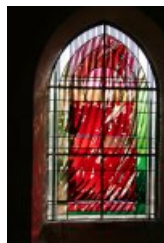
Vitrail contemporain installé dans le musée du vitrail