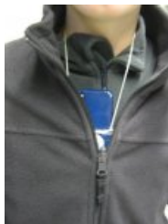
Caler l'appareil dans son vêtement.