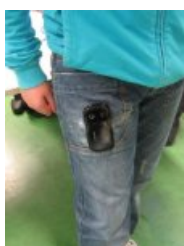
Le scotcher sur soi.