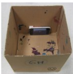
Le mettre dans une boîte en carton trouée et la manipuler.