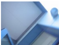
Le mettre dans son sac ouvert et marcher.