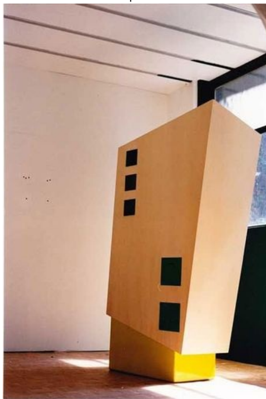
Music'card 1995 195 X 90 X 50 cm Sculpture musicale pour carte magnétique Réalisation Guy HF médium peint, sycamore, informatique, fourrure