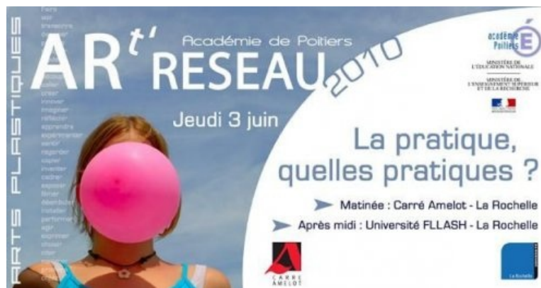
visuel ART'RESEAU 2010