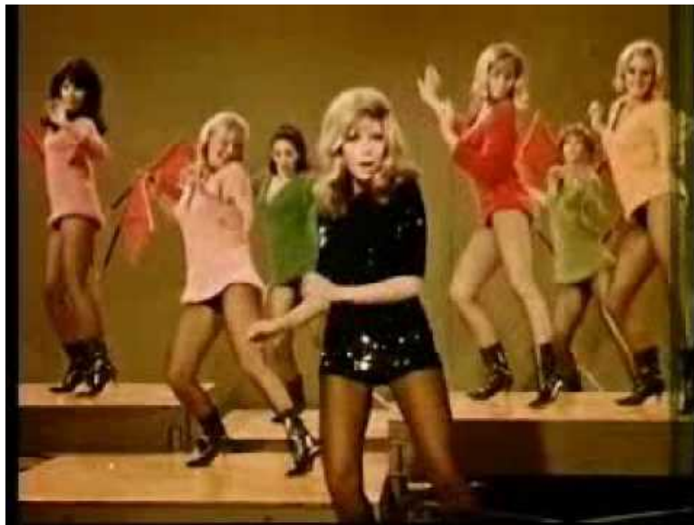
Nancy Sinatra - These Boots Are Made for Walkin'