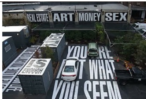
Installation in situ Barbara Kruger, New-York 2010