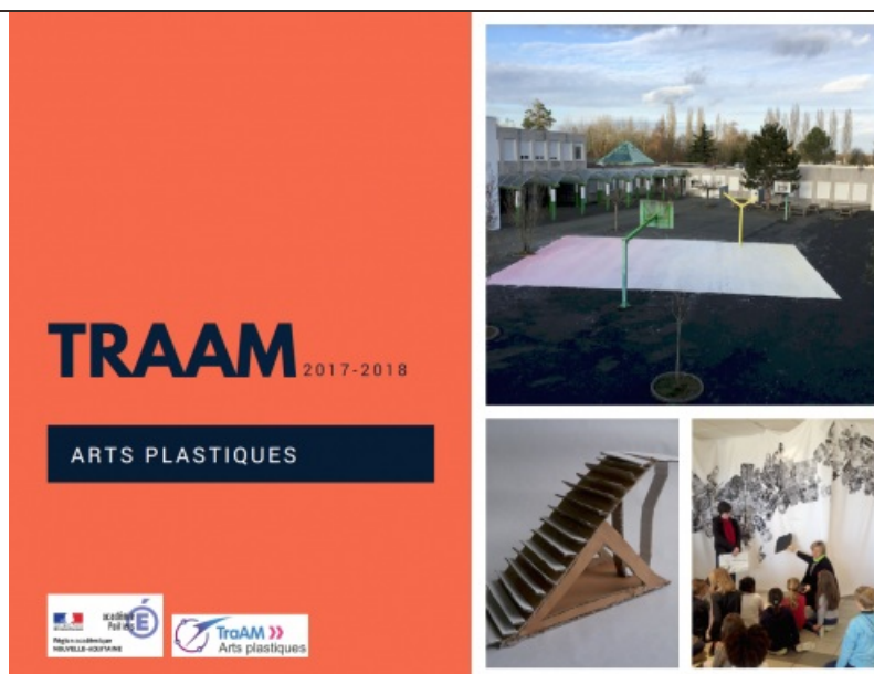
Académie de Poitiers

Synthèse des Travaux Académique Mutualisés Arts plastiques de l'Académie de Poitiers