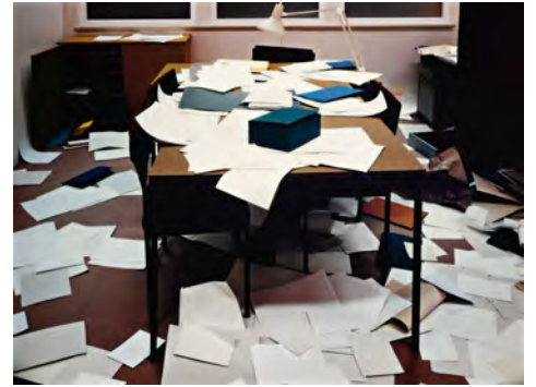
Thomas Demand Büro , 1995, C-Print