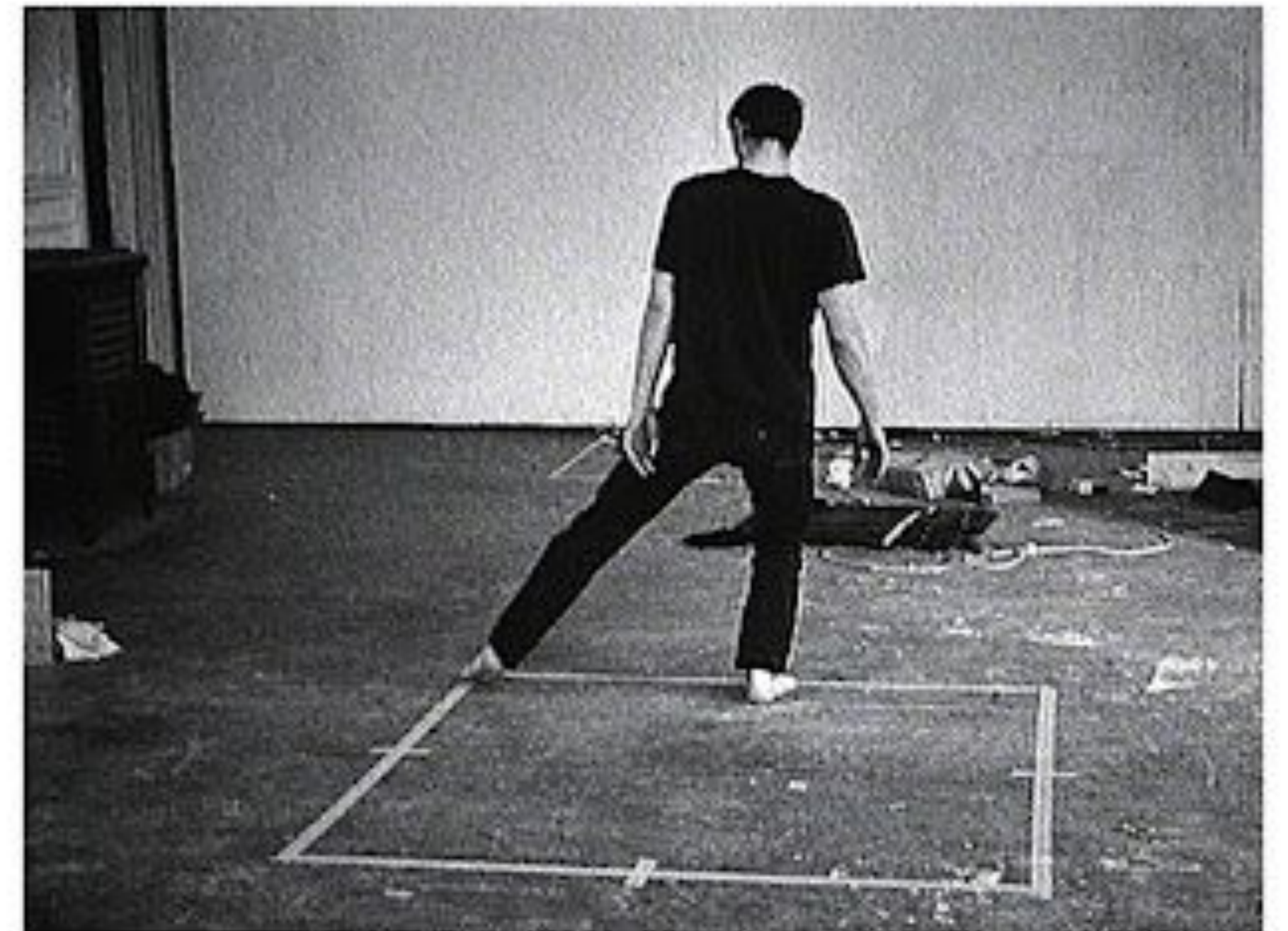
Bruce Nauman Dance or Exercise on the Perimeter of a Square (Square Dance) 1967-1968

https://eduscol.education.fr/729/presentation-du-grand-oral