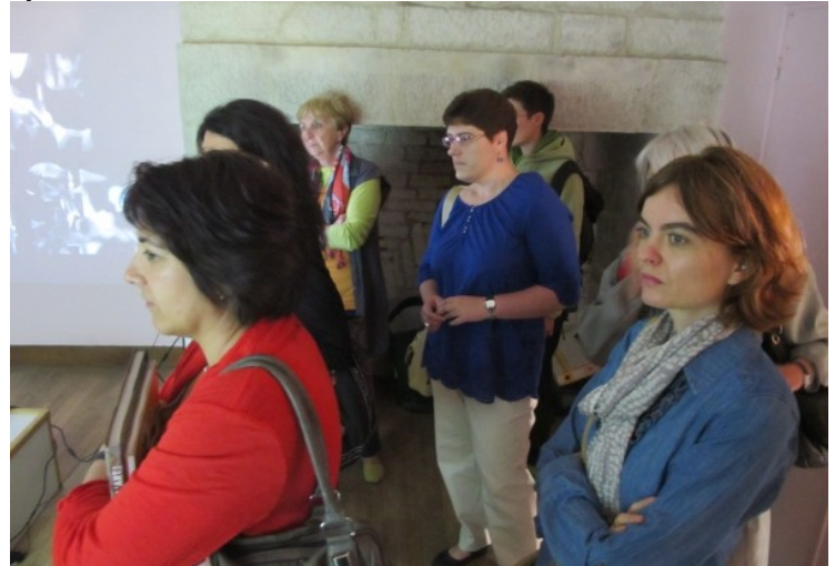
... et les filles de l'autre...