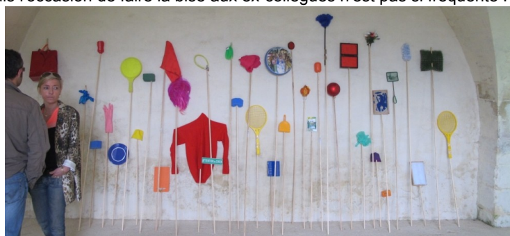
Rapide visite de la splendide salle voûtée du rez de chaussée où la couleur s'étale, s'exhibe