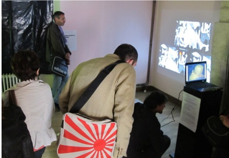
Mais c'est quand même bizarre que les garçons regardent d'un côté...

bref on essaye tous d'en voir un maximum.