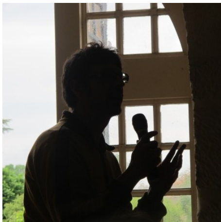
Hein qu'on le reconnaît bien, hein ?