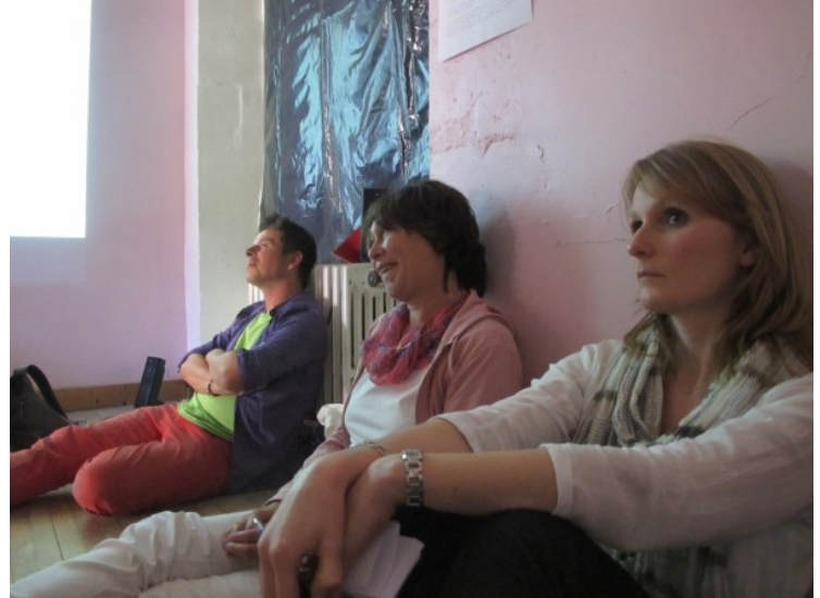
Ici des images de l'atelier « Symbolique des couleurs »