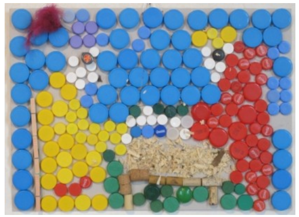
et deux joueurs de cartes

L'exposition se poursuivait dans un bâtiment annexe (on y accédait en passant à côté de ce bel escargot) avec les travaux numériques et vidéo, et là encore, pas le temps de tout voir ni de tout lire, juste celui d'être épaté par les résultats obtenus par les collègues. (et faire regretter un peu de ne plus être de la partie)