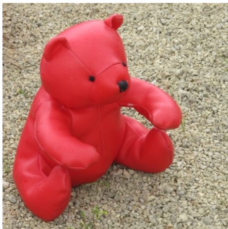
Grand gagnant des représentants des couleurs que plus rouge ça se peut pas, un poids lourd dans la palette déployée sur le jardin de buis de l'Orangerie.