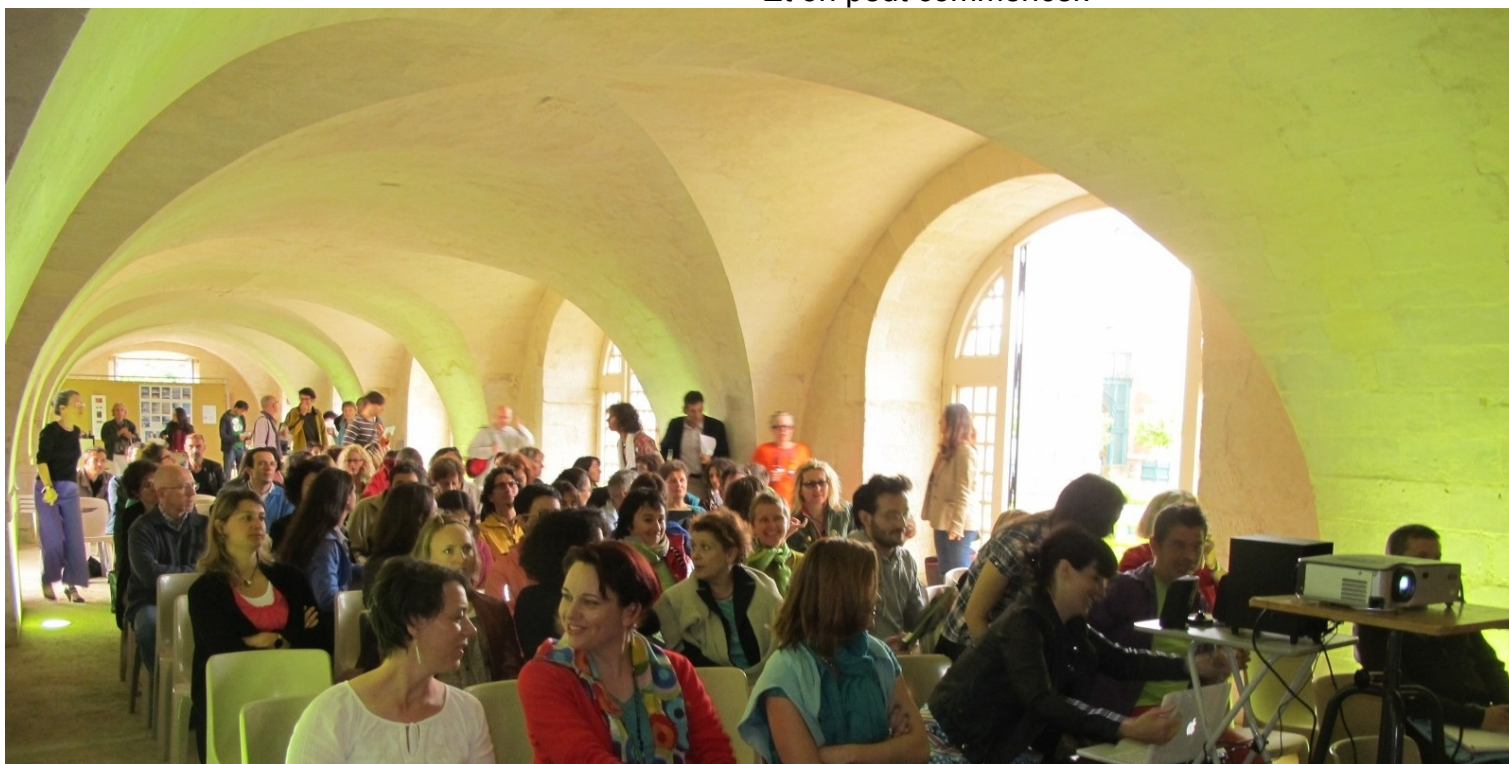
Hein ? Quand je disais qu'elle est splendide, cette salle !