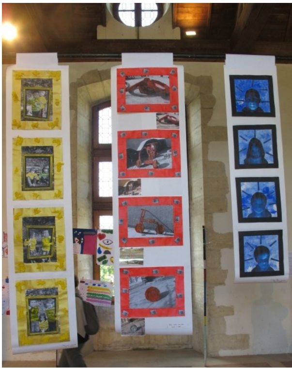
mais moi, que les primaires jouent avec les primaires, ça me ravi complètement...