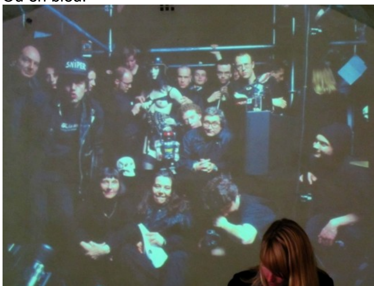
« ou en bleu »