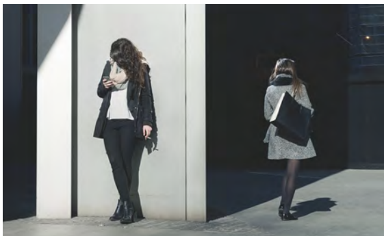
In Company of Strangers, Londres

Un livre sur ce projet sera publié en 2017 par Kehrer Verlag. Il comprendra des photographies des villes de New York, São Paulo, Séoul, Mumbai, Hong Kong, Londres, Lagos, Istanbul et Mexico. Un contexte théorique sera fourni dans trois essais par un sociologue, un urbaniste et un théoricien du film ainsi qu'un entretien avec l'artiste par un historien/conservateur d'art.