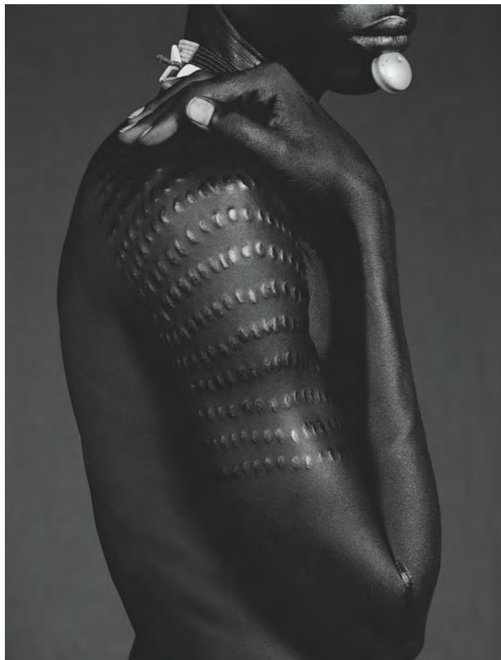
Série Omo River 2005