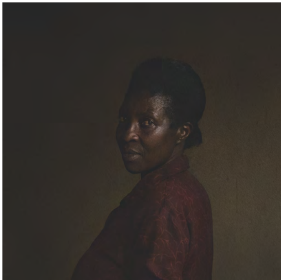
Marie-Rose, Ibaba , 2016

Elle a été touchée par ces rencontres individuelles, par ce que ces femmes ont accepté de lui laisser entrevoir, à elle l'étrangère qui ne parle pas leur langue, ni elles la sienne. Elles et moi, nous nous observons.