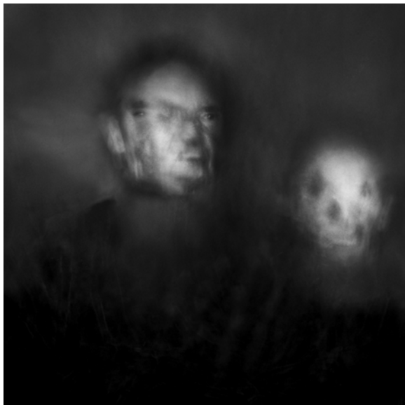
© Tao Douay – Sans titre, 2012

Professeur de philosophie, historien de l'art