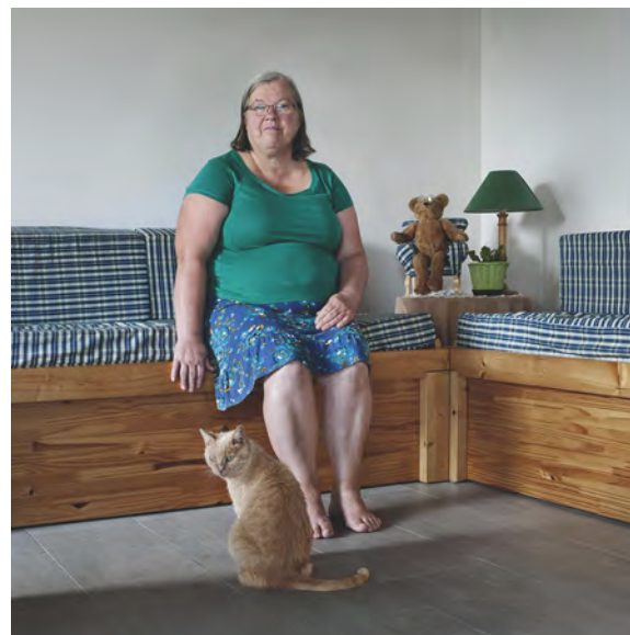
Mum and Arnold

Pour moi, la photographie est une langue en soi, un moyen de comprendre mon entourage, un sentiment que je ne peux pas exprimer en mots. Je suis bien consciente que la réalité photographique n'est qu'une illusion, car le sens profond peut résider dans ce que j'ai laissé de côté délibérément. Une histoire où le spectateur projette ses propres émotions, ses interprétations et ses influences culturelles, les moyens avec lesquels se posent les questions sur notre société. Mes interprétations visuelles se développent à travers une variété de projets avec un thème commun : l'enquête sur le sens de l'identité.