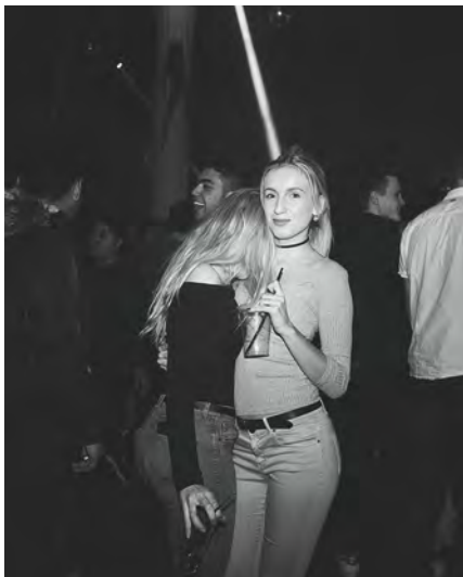
Titre de la série: « Nightclubs » Commande photographique nationale « La jeunesse en France » pilotée par le Centre national des arts plastiques en collaboration avec l'association CÉTÀVOIR FNAC 2017-0037 Collection du Centre national des arts plastiques