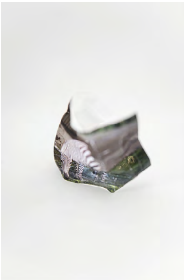
© Mimi Youn – Shape memory VI, 2016

Cependant, elle a senti qu'il y avait des limites pour exprimer ses pensées, ses émotions et ses idées à travers une pratique photographique traditionnelle. Pour son travail, elle utilise un appareil Polaroid. Après avoir pris une photo, elle intervient sur la surface du polaroid. La plupart des photos qu'elle prend semblent ambiguës et vagues en raison de la surexposition intentionnelle. Cependant, les traces coupées dans les photographies semblent paradoxalement fortes et douloureuses. Avant de fixer l'image sur la surface du polaroid, lors du processus de développement, elle modifie souvent la surface en la pliant, en secouant ou grattant avec un couteau, ce qui fait se propager l'émulsion sous la surface. Elle se concentre davantage sur ses actions au cours du développement que sur les résultats finaux de l'image.