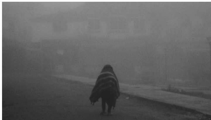
© Ziad Naitaddi – Children of the sea , Salé – Morocco, 2015

Capter et aller au plus profond de l'âme humaine, c'est la seule chose qu'il cherche à atteindre en tant que photographe. Dans cette série de photos noires et brumeuses, il essaye d'exprimer son état d'âme en photographiant des personnages à qui il s'identifie et qui lui ressemblent émotionnellement – mélancoliques, seuls et isolés. En essayant de s'éloigner, d'éviter de montrer les expressions de visages et les portraits mais s'approchant d'eux et exprimant ces mondes intérieurs en plans très larges tout en se servant de l'atmosphère du paysage, l'image, la lumière et la composition.