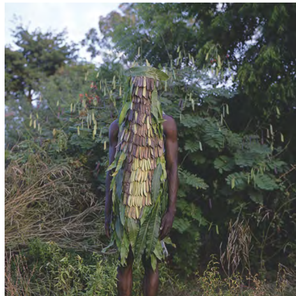
© Delphine Gatinois – Série Les génies

Lors de la résidence, elle souhaite s'immerger dans l'univers de la chasse à courre.