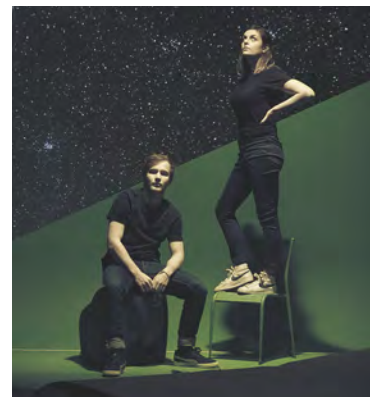
© Antonin Dony & Marie-Clarisse Monin

Ils profiteront de la dynamique de création de cette résidence au même rythme que les artistes invités.