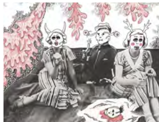
Série Freudian Flip