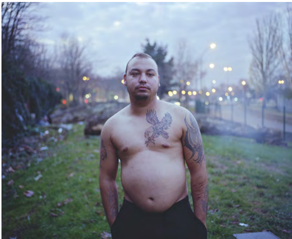
Titre de l'œuvre: ROM (1994) – Porte d'Aubervilliers, Paris 2017 Titre de la série: « CityWalk » Commande photographique nationale « La jeunesse en France » pilotée par le Centre national des arts plastiques en collaboration avec l'association CÉTÀVOIR FNAC 2017-0033 Collection du Centre national des arts plastiques