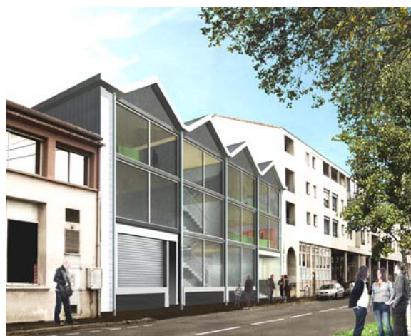
Nouveau bâtiment du FRAC à Angoulême 63 Boulevard Besson Bey

Le bâtiment s'inscrit dans un site, le quartier de l'Houmeau, qui va être amené à évoluer dans les prochaines années, se développant au bord de la rivière et sur l'île qui fait face au bâtiment sis boulevard Besson Bey.