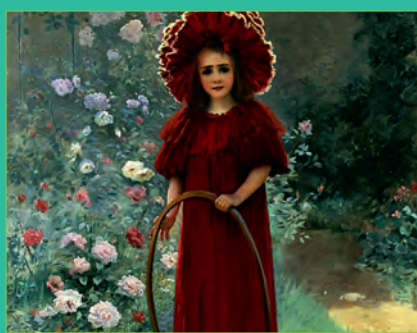
Pierre-André Brouillet - La petite fille en rouge - (1895)

Visite commentée : 3 € / étudiants : 2 € / gratuité : bénéficiaires de la carte culture