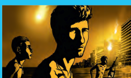
« Valse avec Bachir »