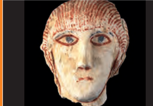
Visage appartenant au décor de stuc de l'église Saint-Pierre à Vouneuil-sous-Biard (VIe s.)

Entrée au musée : 2 € (gratuité le 1 er dimanche du mois) / gratuité : étudiants, bénéficiaires de la carte culture Visite commentée : 3 € / étudiants : 2 € / gratuité : bénéficiaires de la carte culture