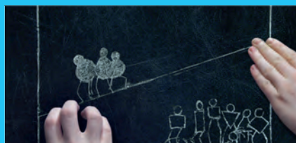
La théorie des ensembles

Renseignements détaillés sur www.tap-poitiers.com et dans le bulletin cinéma en mars 2012