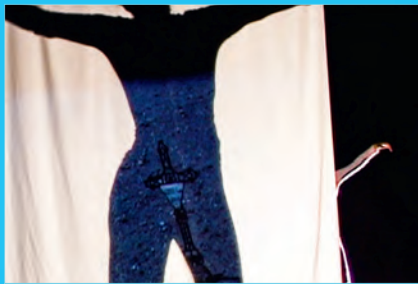
© C e Asphodèle Danse Envol