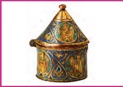
Atelier limousin, custode au décor d'anges (XIIe s.)

Entrée au musée : 2 € (gratuité le 1 er dimanche du mois) / gratuité : étudiants, bénéficiaires de la carte culture Visite commentée : 3 € / étudiants : 2 € / gratuité : bénéficiaires de la carte culture