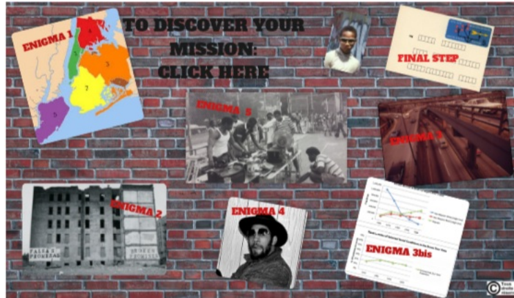
ENTER GAME (Genially)