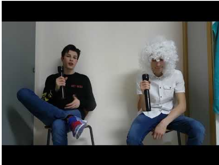
Vidéo Anglais Courtonne "The Mole" (Video Youtube)