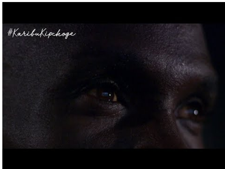
Témoignage vidéo du marathonien Eliud Kipchoge (Video Youtube)

Là encore, La Quizinière offre un support numérique plutôt ludique à l'activité sur la vidéo, qui est insérée directement.