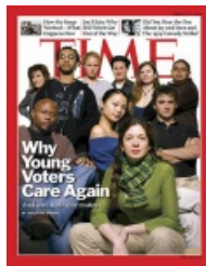
Time, Support de POC

Ils doivent travailler à deux ou en groupes pour construire l'introduction de la présentation du document qui leur servira de modèle pour la suite, lorsqu'ils devront eux-mêmes choisir et présenter leur couverture du Time en lien avec la thématique proposée.