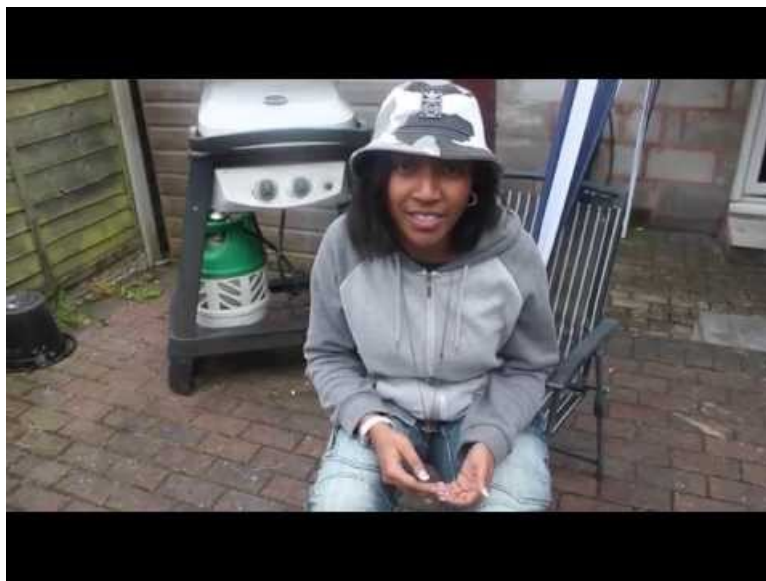
Do Youth really care about Politics? (Video Youtube)

Dans le contexte des élections de 2015 au Royaume Uni, un groupe de jeunes gens est interrogé sur leur désir de voter ou non et les raisons pour lesquelles ils se sentent concernés.