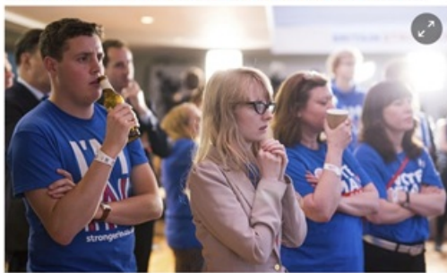
Supporters of the Stronger In campaign react after hearing results in the EU referendum at the Royal Festival Hall in London.

Follow our Tumblr The 75% , collecting responses from young remainers