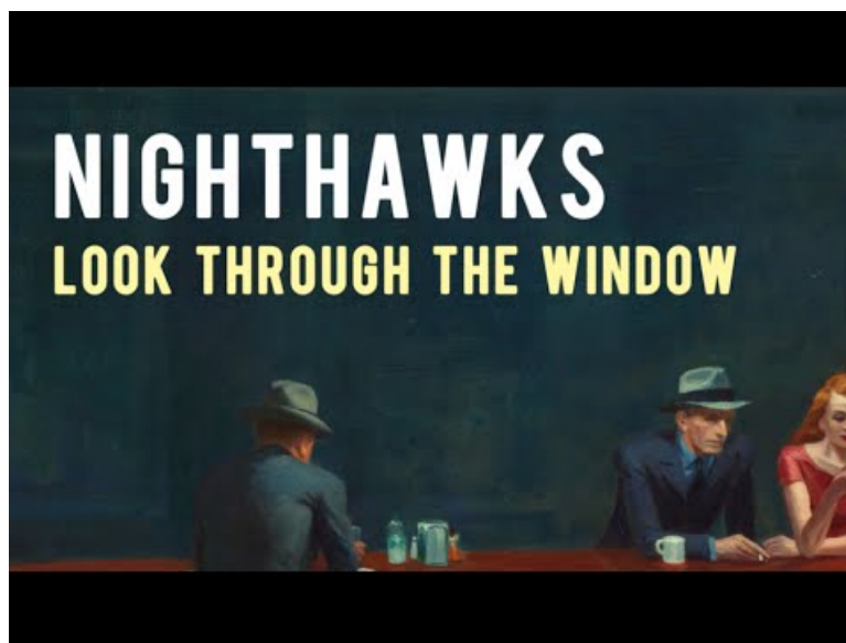
Hopper's Nighthawks: Look Through The Window (Video Youtube)

En complément ou en préambule, une vidéo (ou juste un extrait).