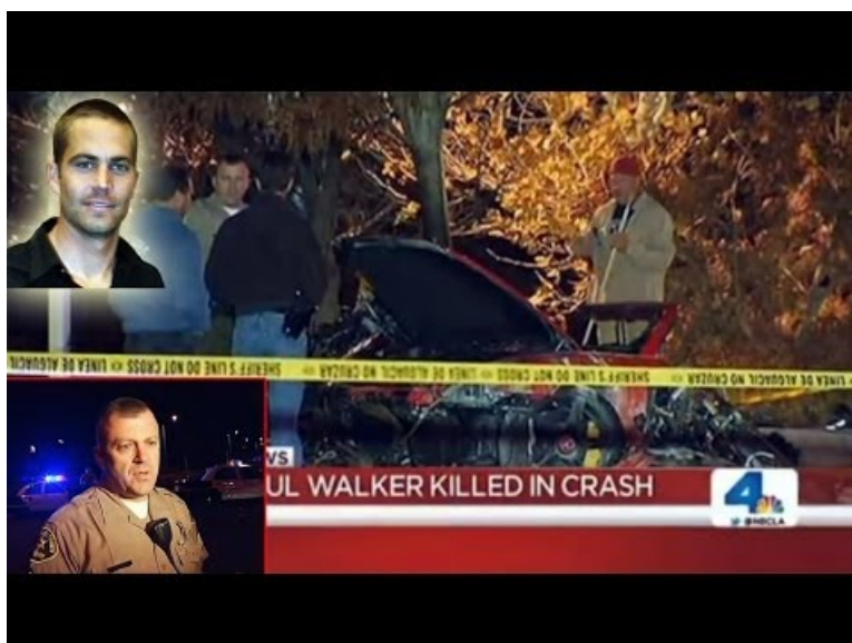
Paul Walker Dead: Fast & Furious star Dies at 40 [Car Crash DETAILS] Paul muere R.I.P 11/30/2013 (Video Youtube)

Cette vidéo d'une durée de 3 minutes 42 annonce de décès de Paul Walker, propose des témoignages de voisins ou de fans, résume brièvement la carrière de l'acteur et diffuse des messages Twitter. On pourra donc demander aux élèves de résumer les circonstances de l'accident, de parler de la vie de Paul Walker et des réactions de ses amis et de son public.