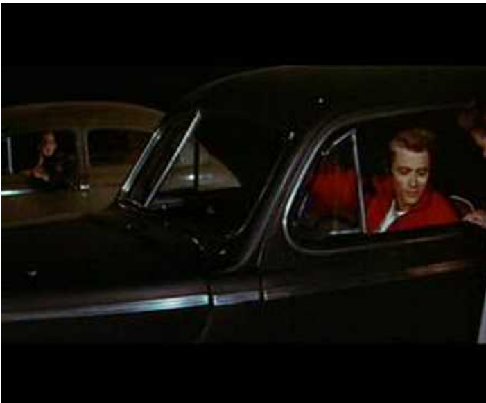
The Chicken Game (Video Youtube) The Chicken Game (James Dean)