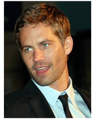
Paul Walker

Il est important de bien définir les outils lexicaux, grammaticaux, syntaxiques et phonologiques nécessaires à l'accomplissement de la