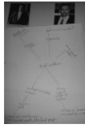
Copie d'un écran

Biographies disponibles sur le site Biography :