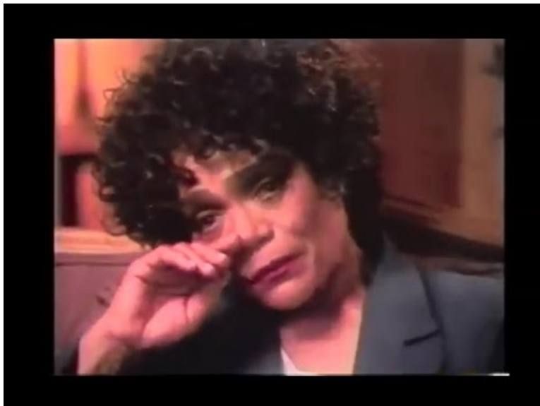
Eartha Kitt Talks About James Dean (Video Youtube)

Cette vidéo dure 4 minutes 47 mais peut-être fractionnée facilement. Les élèves devront identifier les intervenants, le témoignage de son amie Eartha Kitt et son lien avec le décès de James Dean, les circonstances générales de la mort de l'acteur et ce qu'il pensait de la vitesse sur la route.