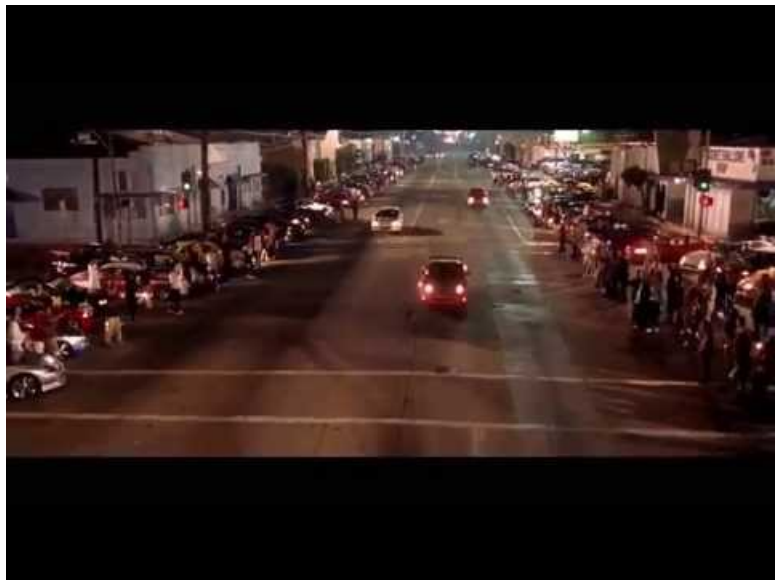
Fast & Furious 1 - First Race (Video Youtube) The Night Race (Paul Walker)

Les élèves devront décrire les deux courses (préparatifs, matériel, déroulement & fin), donner leur point de vue (pourquoi participer à ce genre de course ?, le vainqueur gagne-t-il vraiment ?, le perdant a-t-il l'air déçu ?) et en déduire ce qu'elles apportent à la définition des personnages et leur image vis-à-vis du public.