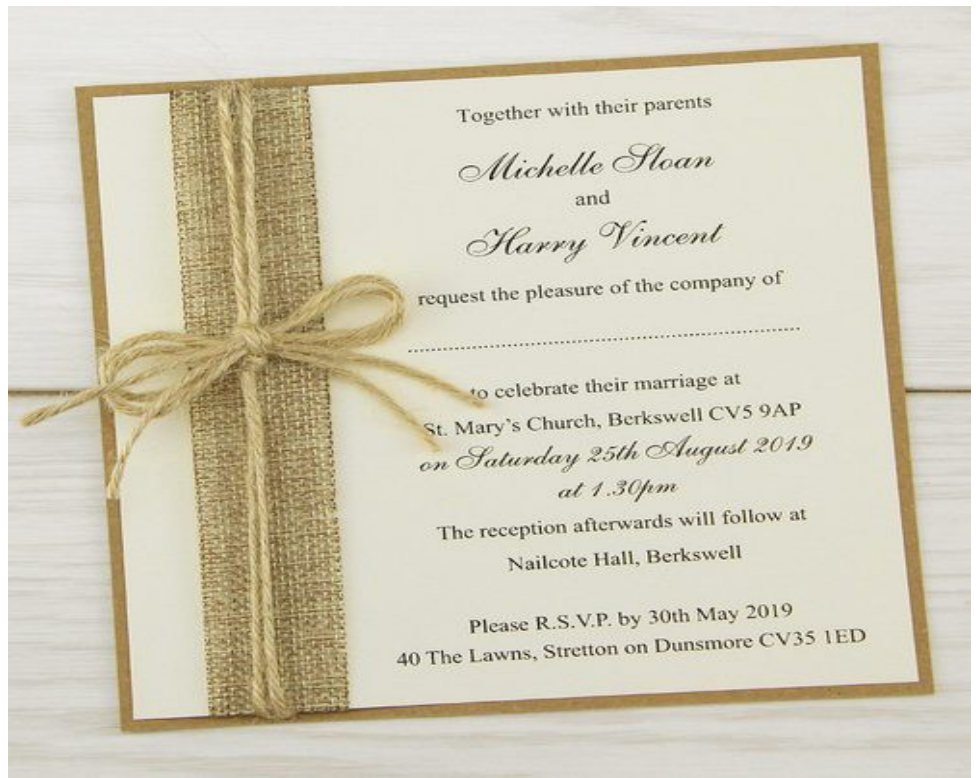
Invitation card 1