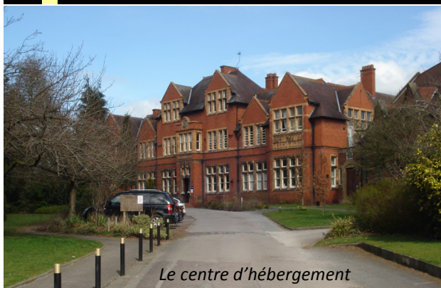
Le centre d'hébergement

Depuis 2009, la section européenne du lycée PA Chabanne a pour vocation de proposer un enseignement ouvert sur les pays anglophones par l'apprentissage renforcé de l'anglais. Les élèves de commerce qui le souhaitent peuvent ainsi bénéficier de manière hebdomadaire, d'une heure de plus en Anglais commercial (c'est la discipline non linguistique ou DNL) avec un professeur de vente et une heure de plus avec leur professeur d'anglais et/ou un assistant anglophone pour approfondir leur connaissance de la culture du pays.