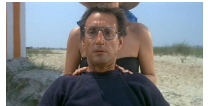
Effet « vertigo » dans Jaws de Spielberg

Et après ? Avant d'assister à une projection du festival, les enseignants peuvent voir un court métrage en classe et préparer avec leurs élèves les questions qui seront posées au réalisateur. Après la projection et la rencontre, des outils pédagogiques remis aux enseignants permettent un travail approfondi en classe. Il est possible de poursuivre un travail d'écriture critique ou une réalisation de critique en vidéo.