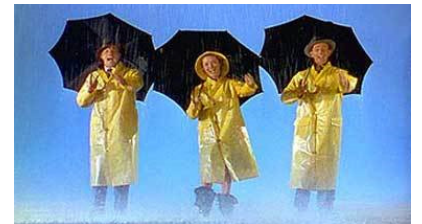
Du muet au parlant : Singin' in the Rain