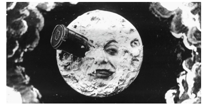
Premiers effets spéciaux chez Méliès

La durée et le contenu de l'atelier peuvent évoluer selon la demande. Durée idéale : 3 heures. Matériel nécessaire : vidéo-projection avec son.