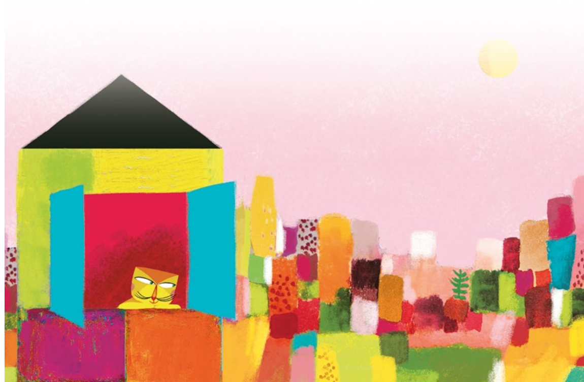
Illustration réalisée par Peggy Nille pour l'album Le Chat et l'oiseau , coll. « Pont des arts », L'Élan vert/CRDP de l'académie d'Aix-Marseille, 2011.

Man kann dieses Bild benutzen, wenn die Schüler eine Landschaft malen sollen [Siehe Arbeitsplan 3, Schulstunde 2].