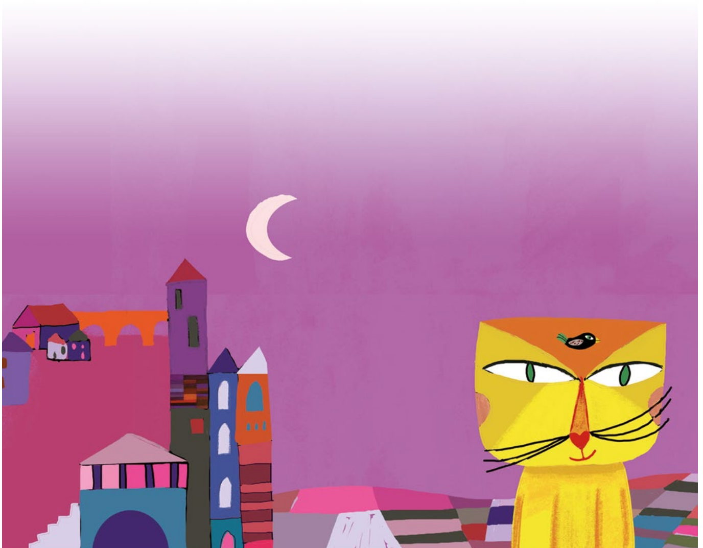
Illustration réalisée par Peggy Nille pour l'album Le Chat et l'oiseau , coll. «Pont des arts», L'Élan vert/CRDP de l'académie d'Aix-Marseille, 2011.