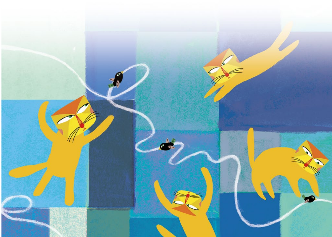
Illustration réalisée par Peggy Nille pour l'album Le Chat et l'oiseau , coll. «Pont des arts», L'Élan vert/CRDP de l'académie d'Aix-Marseille, 2011.