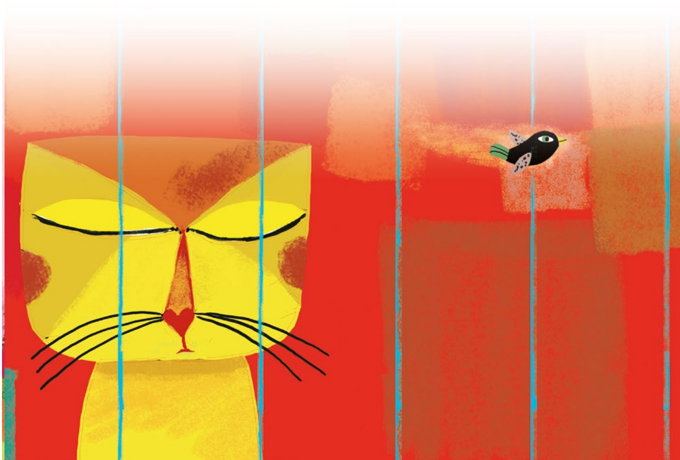
Illustration réalisée par Peggy Nille pour l'album Le Chat et l'oiseau , coll. « Pont des arts », L'Élan vert/CRDP de l'académie d'Aix-Marseille, 2011.

Die Schüler müssen sagen können, was den Zustand der Katze verrät und was der Unterschied zum Zustand des Vogels ist. Sie müssen ihren Standpunkt verteidigen können [Siehe weiter unten].