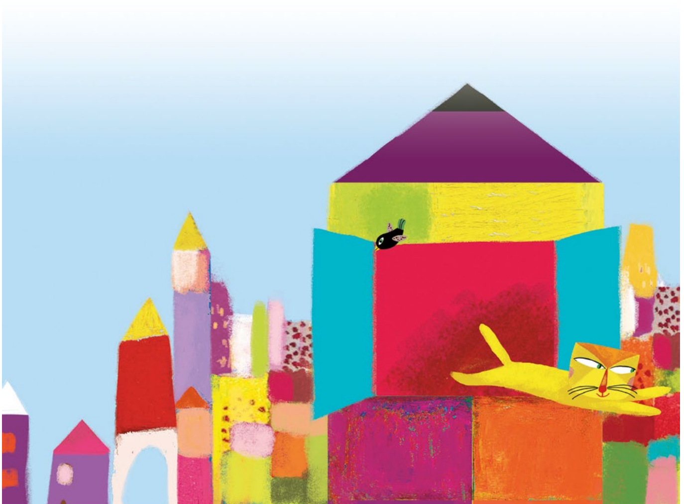
Illustration réalisée par Peggy Nille pour l'album Le Chat et l'oiseau , coll. « Pont des arts », L'Élan vert/CRDP de l'académie d'Aix-Marseille, 2011.

Die Schüler können dazu aufgefordert werden, in dem Bild die Elemente zu finden, die eine Veränderung für die Katze darstellen. Sie können dann auch die Elemente, die ihren neuen Zustand zeigen, beschreiben (Siehe Seite 10).