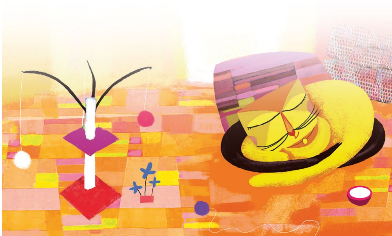
Illustration réalisée par Peggy Nille pour l'album Le Chat et l'oiseau , coll. « Pont des arts », L'Élan vert/CRDP de l'académie d'Aix-Marseille, 2011.